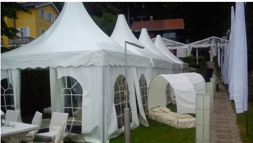
Pagoden in Reihe angebaut