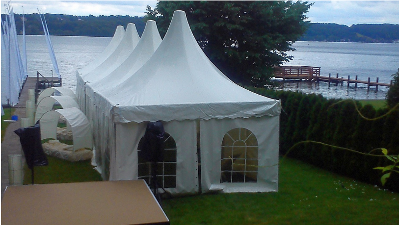
Pagodenzelt mit Fenstern