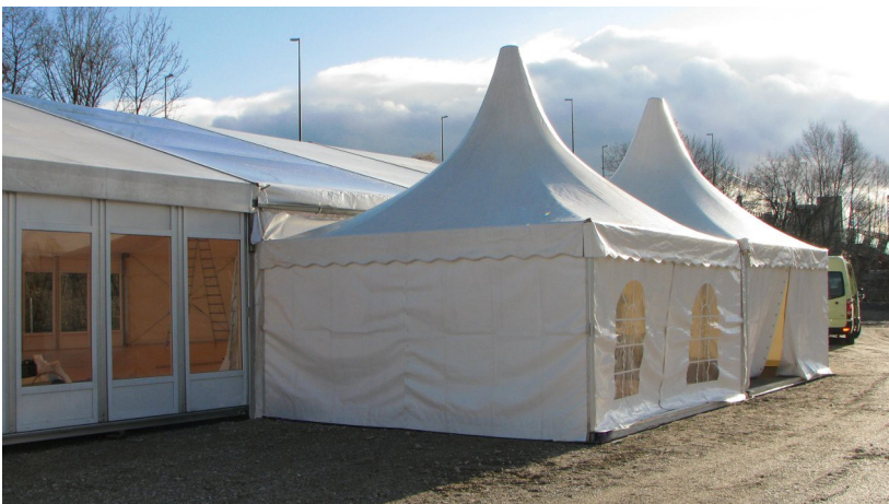
Pagoden längsseitig angebaut